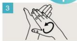
Frótese las palmas de las manos entre sí.