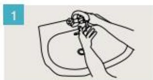
Mójese las manos.

DURACIÓN DEL LAVADO: entre 40/60 segundos