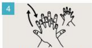
Frótese la palma de la mano derecha contra el dorso de la mano izquierda entrelazando los dedos, y viceversa.