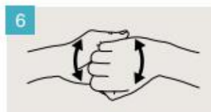
Frótese el dorso de los dedos de una mano contra la palma de la mano opuesta, manteniendo unidos los dedos.