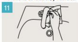
Utilice la toalla para cerrar el grifo.