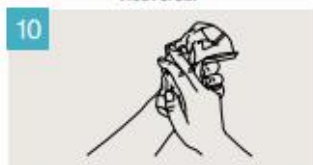
Séquese las manos con una toalla de un solo uso.