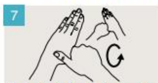
Rodeando el pulgar izquierdo con la palma de la mano derecha, fróteselo con un movimiento de rotación, y viceversa.