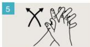
Frótese las palmas de las manos entre sí, con los dedos entrelazados.