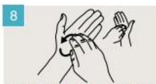
Frótese la punta de los dedos de la mano derecha contra la palma de la mano izquierda, haciendo un movimiento de rotación, y viceversa.