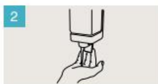
Aplique suficiente jabón para cubrir todas las superficies de las manos.